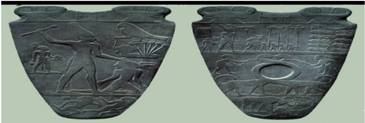
لوحة الملك المصري "نعر-مر"

4.3. الختم الأسطواني للملك "نعر-مر" ولوحته: تمثل المناظر المنقوشة على الختم مرحلة من مراحل كفاح "نعر-مر" لتوحيد مصر، ظهر على الختم ثلاثة صفوف من أسرى الليبيين قيدت أيديهم وفي الجانب الايمن كتب اسم "نعر-مر" وعلى اليسار منه كتابة تعني "خسف التحنو" اي قتل التحنو. في حين ظهر على أحد وجه لوحته مجموعة من الاسرى الليبيين الذين وقعوا تحت ايدي الملك "نعر-مر" بسبب الغارة التي شنّها عليهم غرب الدلتا، والغنائم التي غنمها معه.