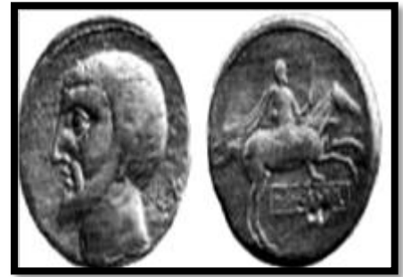
عملة الملك سفاكس