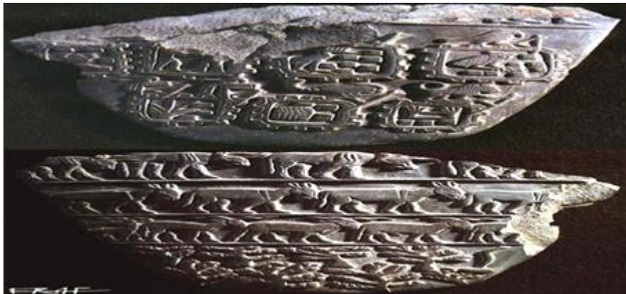
لوحة الحصون والغنائم

3.3. لوحة الحصون والغنائم: وتعرف ايضا باسم لوحة الليبيين او لوحة الضريبة الليبية او لوحة التحنو، عثر عليها بمقبرة ملكية تعود للملك "وازي" الملقب بالعقرب في ابيدوس من مصر العليا.