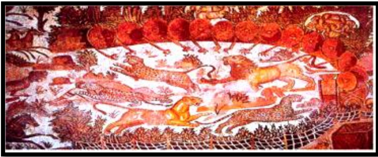
فسيفساء الصيد هيبو ريجيوس(عنابة)