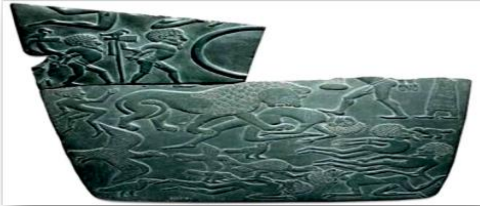
لوحة الاسد والعقبان

2.3. لوحة الأسد والعقبان: يظهر من خلالها محاربين لبيين ملتحون وشعرهم طويل يرتدون جراب العورة، وتكمن اهمية اللوحة في انها تحمل بقايا علامة تصويرية يعتقد انها تعني ارض قبيلة التحنو الليبية.